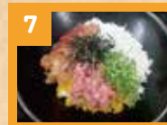
7 しらすとWまぐろ丼 880円