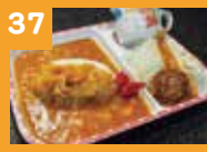
37 お子様カレーセット 650円