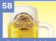
58 生ビール(中) 480円