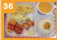
36 お子様セット 650円