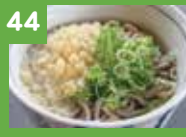
44 かけそば 330円