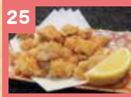
25 なんこつ唐揚げ 480円