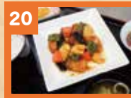
20 酢豚定食 900円