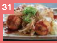
31 揚げたこ焼き 500円