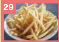
29 フライドポテト 280円