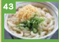
43 かけうどん 330円