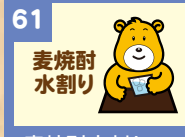
61 麦焼酎水割り 280円