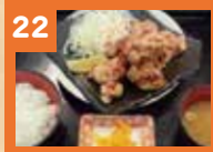
22 若鶏唐揚げ定食 910円