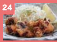
24 タコ唐揚げ 520円