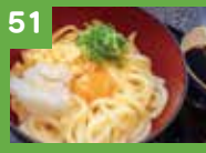
51 釜玉うどん 400円