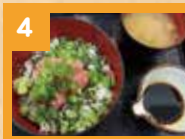
4 ネギトロ丼 650円