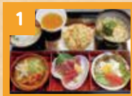
1 土佐丸御膳 1,200円