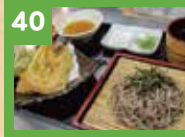
40 天ざるそば 850円