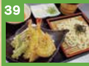
39 天ざるうどん 850円