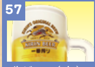
57 生ビール(大) 800円