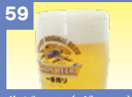
59 生ビール(グラス) 290円