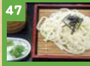
47 ざるうどん 430円