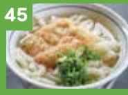
45 きつねうどん 390円