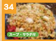
34 海鮮チャーハン 700円