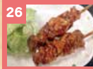
26 焼き鳥 350円