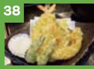
38 天ぷら単品 430円