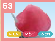
53 かき氷 210円