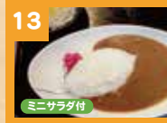
13 カレーライス 650円