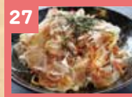
27 焼きそば 520円