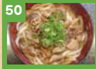
50 肉うどん 600円