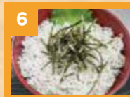
6 しらす丼 650円