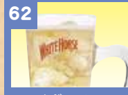
62 ハイボール 350円