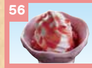
56 いちごフラッペ 330円