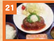
21 和風ハンバーグ定食 900円