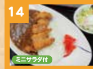
14 チキんカツカレー 800円