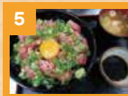
5 メガネトロ丼 900円