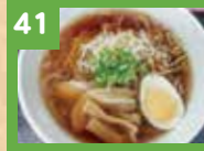
41 醤油ラーメン 580円