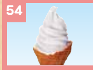
54 ソフトクリーム 300円