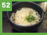
52 ミニうどん 210円