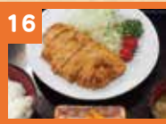
16 厚切りロースカツ定食 850円