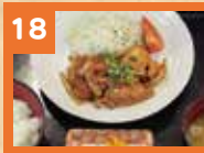
18 生姜焼き定食 820円