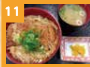
11 三元豚コースカツ丼 780円