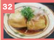
32 揚げ出し豆腐 360円