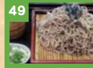
49 ざるそば(大盛) 600円