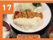
17 チキン南蛮定食 800円