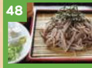
48 ざるそば 430円