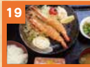
19 大海老フライ定食 950円