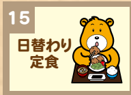
15 日替わり定食 750円