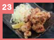
23 若鶏唐揚げ 550円