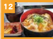
12 親子丼 570円