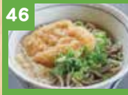
46 きつねそば 390円