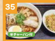
35 ラーメンセット 900円