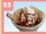
55 ミニパフェ 330円