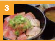
3 まぐろ三味丼 800円