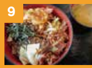
9 牛スタミナ丼 650円