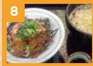
8 乙女まぐろ丼とミニうどんセット 790円