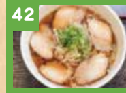
42 チャーシューメン 700円