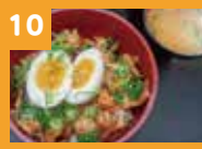
10 豚てり玉丼 600円