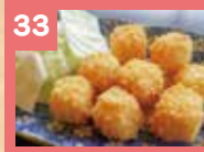
33 チーズカリカリ 380円